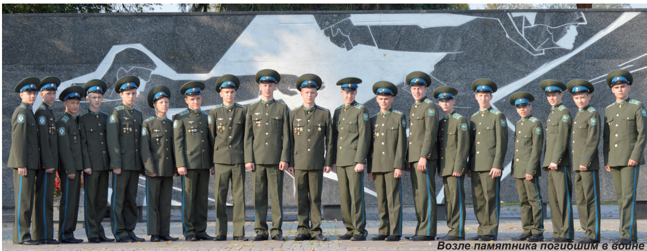
Возле памятника погибшим в войне